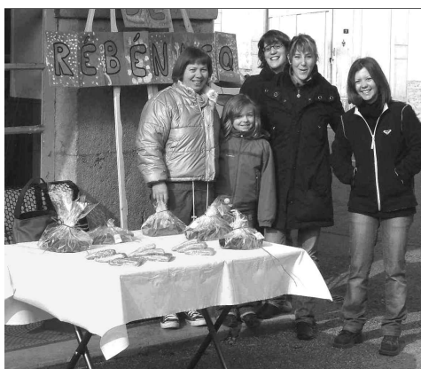
Le coin sourire : une vente de gâteaux au profit de l'école a été réalisée par les parents d'élèves le jour des élections.