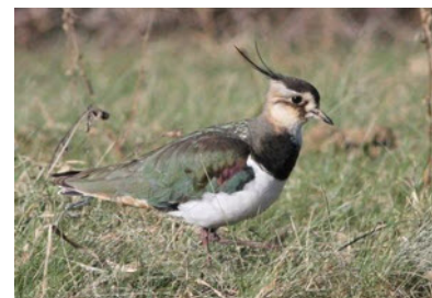
Un vanneau, sur nos coteaux, avec sa huppe caractéristique.

La vague de froid exceptionnelle qui a sévi tout au long du mois de février nous a valu pendant une dizaine de jours la présence de vanneaux huppés à l'entrée de la Vallée d'Ossau. Reconnaisables en vol à leur silhouette noire et blanche et, de plus près, aux plumes en huppe sur la tête, ils sont en hiver plutôt cantonnés dans la moitié nord de la France. Mais le froid exceptionnel les a conduits à descendre nettement plus au sud cette année.